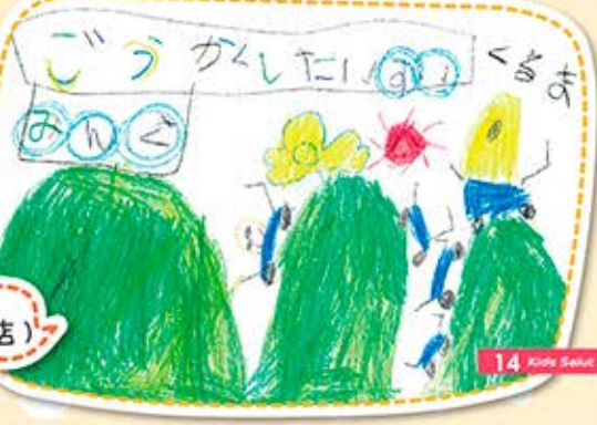
にい たける 西井 健流くん(宇治南店)