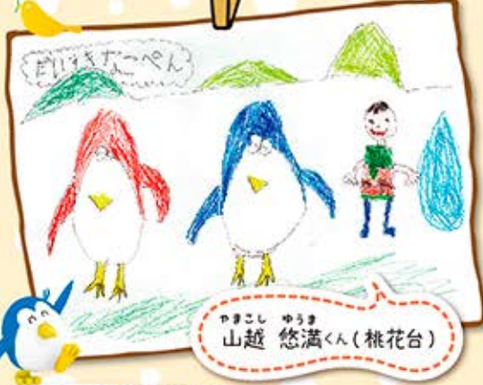
やまこし ゆうき 山越 悠満くん(桃花台)