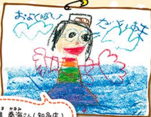
おかしま かのみ 大島 奏海さん(知多店)